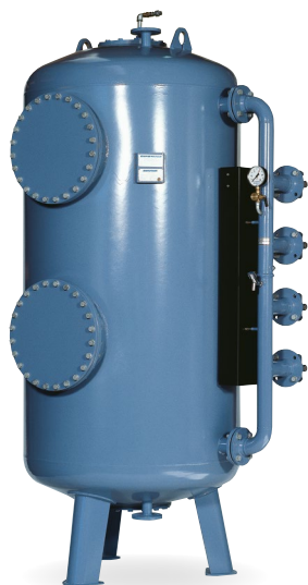
Tlakový filter typ TFB 14.

Úpravňa vody na výrobu 3x 25 m 3 /h ultra čistej vody pre chemickú prevádzku. Inštalácia obsahuje 3 nezávislé na ráme zmontované linky, každá s reverznou osmózou vybavenou vodou šetriacim stupňom RO-plus, nasledovaná dočistovacím systémom EDI.