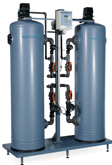
Zmäkčovač typ SMH 602.