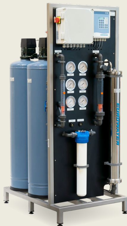
Na ráme inštalovaná kompaktná jednotka CU:RO; kompletná jednotka reverznej osmózy s integrovanou predúpravou na jednom ráme z nerezovej ocele – pripravená na použitie.

Naše dlhodobé skúsenosti a modulárna konštrukcia zariadení garantujú vysokú spoľahlivosť úpravnej vody, krátke dodacie termíny a konkurenčné ceny.